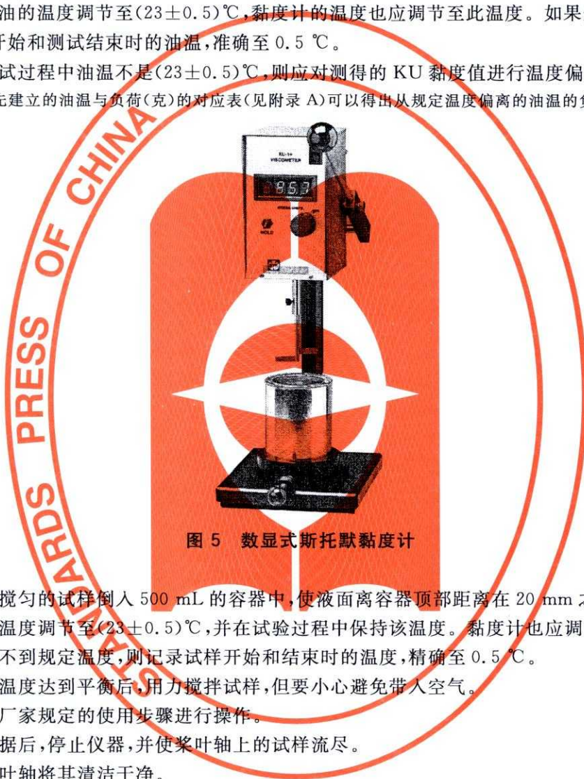
图 5 数显式斯托默黏度计

注:通过预先建立的油温与负荷(克)的对应表(见附录 A)可以得出从规定温度偏离的油温的负荷修正。