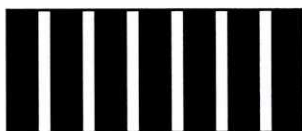
图 3 计时器调至 200 r/min 时的频闪线条

注:转速不是 200 r/min 时,频闪计时器会呈现其他图形(见图 4)。因此在进行任何试验前应测定产生 200 r/min 时对应的图形。